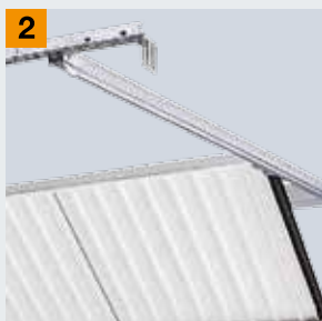
Stropná vodiaca koľajnica