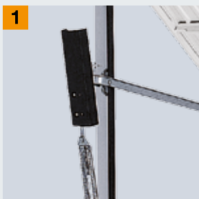
Ochrana proti privretiu prstov

V priehlbine koľajnice sa brána bezpečne zastaví.